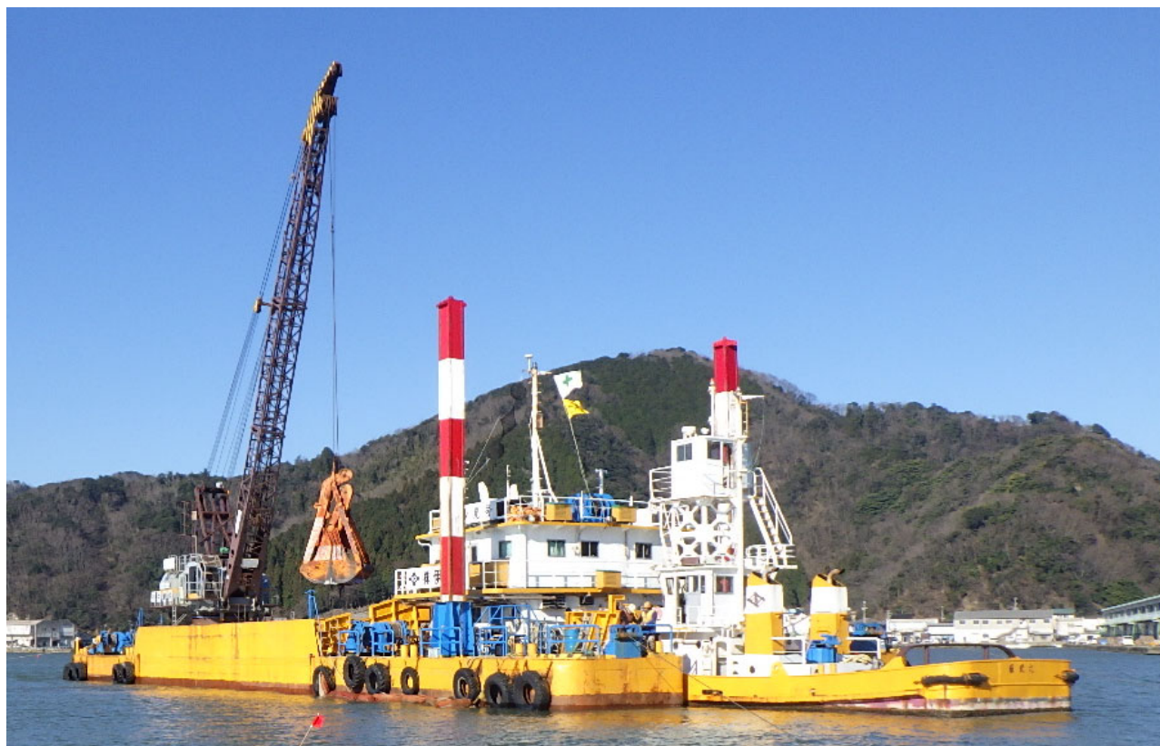
【クレーン部主要諸元表】SKK-400GDA-H