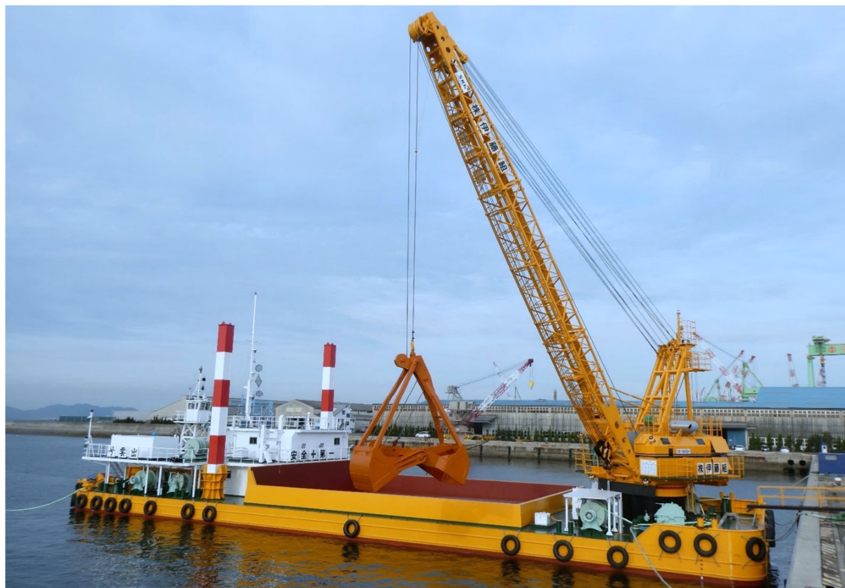
【クレーン部主要諸元表】SKK-403GDA-H