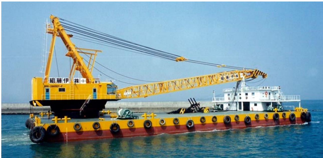
【クレーン部主要諸元表】SKK-2800DT-F